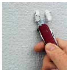
Ännu inte överarbetningsbar

Underlaget måste vara helt genomtorkat, frost- och isfritt vid applicering av QS- och FT-produkter. För att vara säker på att underlaget är torrt, bör du genomföra ett skrapprov med trubbigt föremål. Ytterligare beläggning får endast appliceras när ytan inte deformeras.