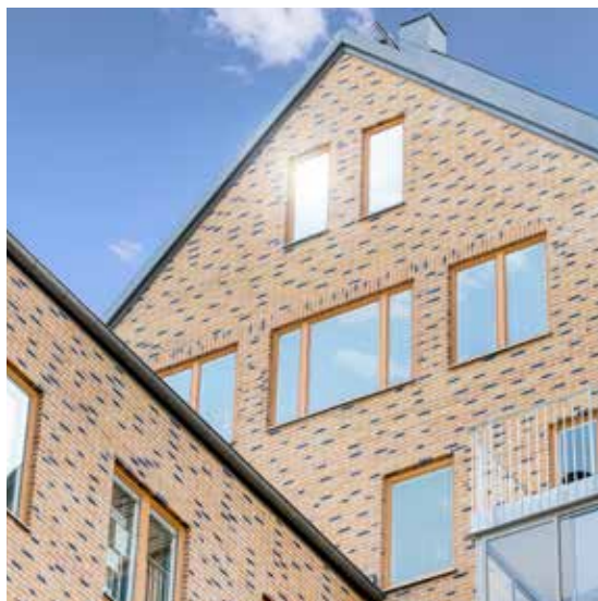
Bild framsida (vänster) Zac Seguin, Paris. Speglar parker, vatten och klinkerfasader. Arkitekt: Beckmann N'Thépe StoVentec Glass m.m.

Bild framsida (höger) högerspalt (överst) Kv Alnen/Astrologen, Linköping Arkitekter: M5 arkitektur, Falk Arkitekter (Anders Falk), Sonark Arkitektkontor, White arkitekter (Barbara Vogt) Entreprenör: Botrygg Bygg AB StoTherm Mineral, StoBrick (490, 640, 650, 670), StoLotusan®