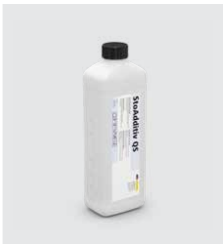
StoAdditiv QS fungerar till StoColor Silco/Silco Fill, StoColor Jumbosil samt StoCryl V200.